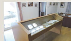
展示ボックス / 笹沢左保直筆の原稿をご覧ください。